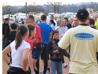
Deuxième Trophée Inter-Entreprises

Les Trophées CCI inter-entreprises ont été décernés, ce 14 décembre, à la CCI du Beaujolais coorganisatrice de la manifestation à travers sa marque Made in Beaujolais avec l'association Beaujolais Runners.