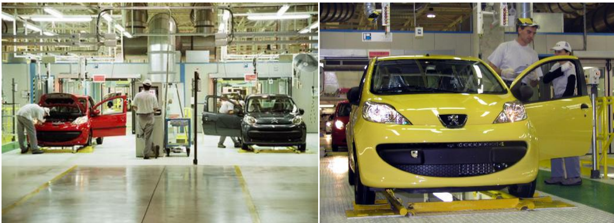
Usine TPCA en République tchèque

Présence française : TPCA, Faurecia, Valeo, St. Gobain, Bontaz, FSD France, Mecaplast, Lisi Automotive.